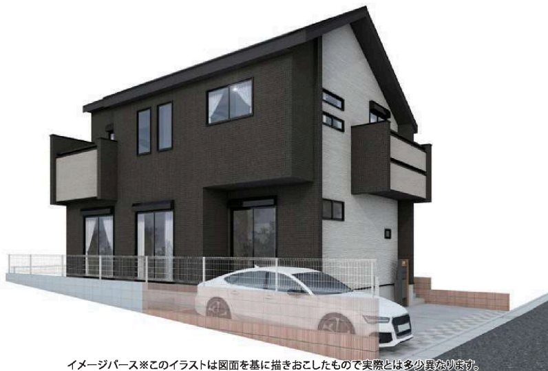
イメージパース※このイラストは図面に基に描きおこしたもので実際とは多少異なります。

♪住宅設備機器保証サービス対象物件▶▶あんしんプラチナパック15年保証12万円(税込)