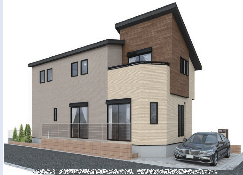
こちらのパースは図面を基に描き起こされており、実際とは多少異なる場合がございます。

21帖強のLDKは家族のコミュニケーションが広がりやすく、ゆったりと寛げる落ち着いた空間です。[太陽光パネル搭載物件] 住宅設備機器保証サービス対象物件▶▶あんしんプラチナパック15年保証12万円(税込)