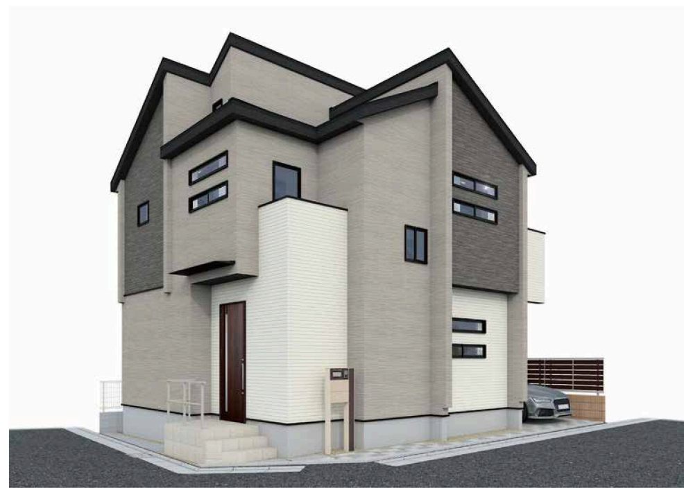
イメージパース※このイラストは図面を基に描きおこしたもので実際とは多少異なります。

住宅設備機器保証サービス対象物件 ▶▶ あんしんプラチナパック15年保証12万円 (税込)