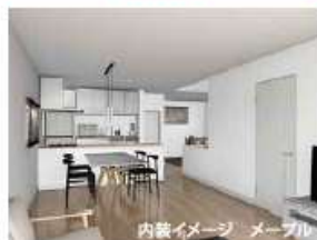
内装イメージ メーブル