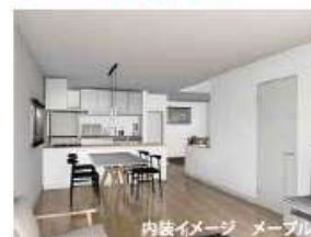
内装イメージ メーブル