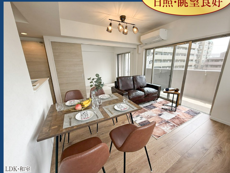
LDK・和室 ※家具・調度品等は販売価格に含まれません